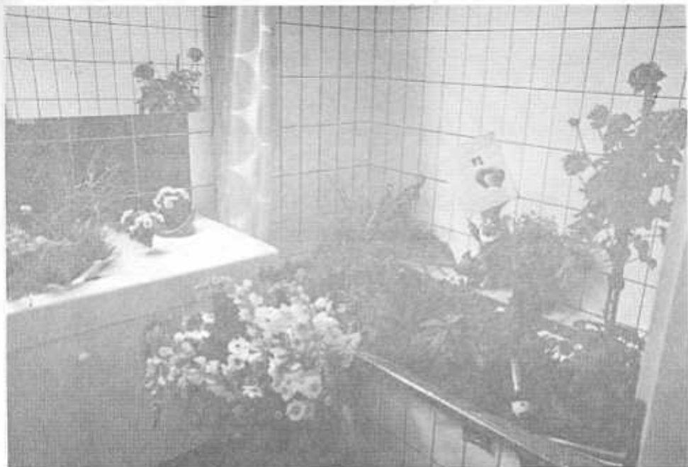
Müllers Badetube vo dr Pfyffergrubbe dekoriert...